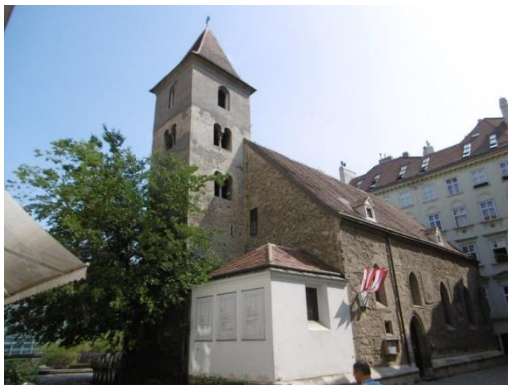
Crkva sv. Ruperta

ISTAKNUTI CILJEVI: crkva sv. Ruperta, crkva Servita, crkva Maria am Gestade, crkva Am Hof, crkva Škota, crkva Minorita, crkva sv. Mihajla, crkva sv. Augustina, crkva Kapucina, crkva Franjevac, katedrala sv. Stjepana