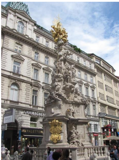
Kugin stup na Grabenu

ISTAKNUTI CILJEVI: muzej Albertina, grobnica habsburgovaca Kapuzinergruft, katedrala sv. Stjepana, kugin stup, palača Hofburg, palača Stallburg (lipicaneri), Austrijska nacionalna knjižnica, crkva sv. Augustina