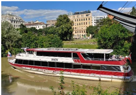
MS Wien beim Siemens-Nixdorf-Steg

HIGHLIGHTS: Wohnhaus Hundertwasser, Schwimmende Gärten, Urania, Herrmann-Park, Kunst Haus Wien