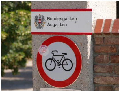
Eingangstor in den Augarten

HIGHLIGHTS: Historischer Barockgarten, Augarten Porzellanmanufaktur, Palais der Wiener Sängerknaben.