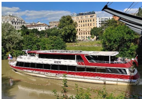
MS Wien beim Siemens-Nixdorf-Steg

HIGHLIGHTS: Wohnhaus Friedensreich Hundertwasser, Rossauer Kaserne, „Schwimmende Gärten“, Schiffstation Wien City, Urania, Kunst Haus Wien