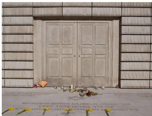
Mahnmahl für die österreichischen jüdischen Opfer der Schoa am Judenplatz

HIGHLIGHTS: Judenplatz, Hoher Markt, Stadttempel, „Die gelbe Straße“, ehem. Leopoldstädter Tempel, Geburtshaus Viktor Frankl, Wohnhaus Theodor Herzl, ehem. Türkischer Tempel, Karmelitermarkt, ehem. Judenstadt Im Werd