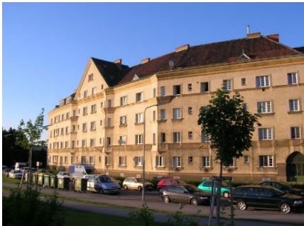
Ältester Wohnbau des Roten Wien: Matzleinstaler Hof

HIGHLIGHTS: Rüdigerhof, Margareten Schloss, ehem. Synagoge, Siebenbrunnen-Denkmal, Tröpferlbad Einsiedlerplatz, Reumann-Hof, Metzleinstaler Hof, Theodor-Körner-Hof, Matzleinsdorfer Hochhaus