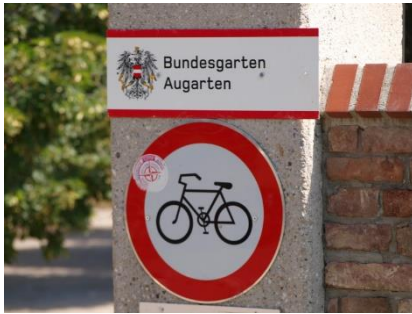
Eingangstor in den Augarten

HIGHLIGHTS: Historischer Barockgarten, Augarten Porzellanmanufaktur, Palais der Wiener Sängerknaben.