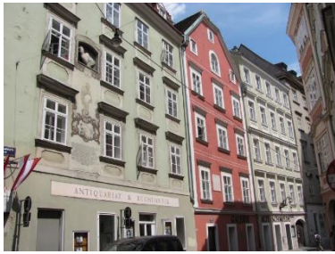
Schönlaterngasse mit Basilikenhaus

HIGHLIGHTS: Ruprechtskirche, Griechengasse, Schönlaterngasse, Bäckerstraße, Blutgasse, Franziskanerplatz, Ballgasse, Graben, Judenplatz, Altes Rathaus, Kirche Maria am Gestade