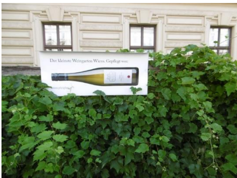
Der kleinste Weingarten Wiens befindet sich am Schwarzenbergplatz

HIGHLIGHTS: Palais Schwarzenberg, Schwarzenberg-Denkmal, Hoher Markt, Augustiner-Kirche