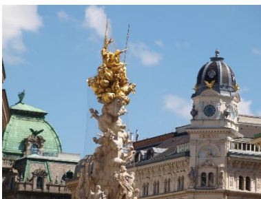
Pestsäule am Graben

HIGHLIGHTS: Albertina, Kapuzinergruft, Stephansdom, Pestsäule, Hofburg, Stallburg (Lipizzaner), Österreichische Nationalbibliothek, Augustinerkirche