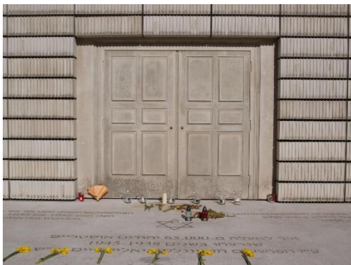
Mahnmal für die österreichischen jüdischen Opfer der Schoa am Judenplatz

HIGHLIGHTS: Judenplatz, Judengasse, Stadttempel, „Die gelbe Straße“, Tempelgasse, Viktor Frankl, ehem. Ghetto, Kirche St. Leopold