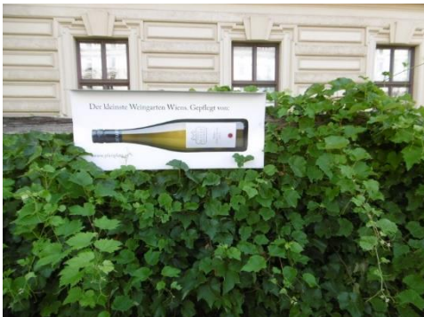
Der kleinste Weingarten Wiens befindet sich am Schwarzenbergplatz

HIGHLIGHTS: Palais Schwarzenberg, Schwarzenberg-Denkmal, Hoher Markt, Augustiner-Kirche