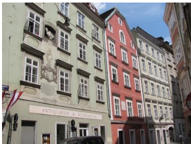
Schönlaterngasse mit Basilikenhaus

HIGHLIGHTS: Ruprechtskirche, Griechengasse, Schönlaterngasse, Bäckerstraße, Blutgasse, Franziskanerplatz, Ballgasse, Graben, Judenplatz, Altes Rathaus, Kirche Maria am Gestade