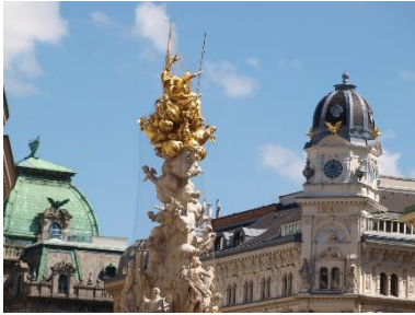
Pestsäule am Graben

HIGHLIGHTS: Albertina, Kapuzinergruft, Stephansdom, Pestsäule, Hofburg, Stallburg (Lipizzaner), Österreichische Nationalbibliothek, Augustinerkirche