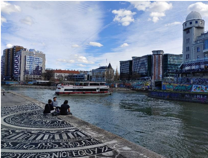
Schiffwendestelle am Donaukanal

HIGHLIGHTS: Schemerlbrücke, MVA Spittelau, Rossauer Kaserne, „Schwimmende Gärten“, Otto Wagners Schützenhaus, Schiffstation Wien City, Urania, Kunst Haus Wien, EBS Simmering