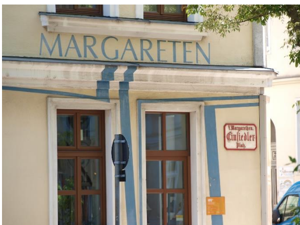
Am Einsiedlerplatz (Margareten)

HIGHLIGHTS: Karlskirche, Theresianum, Siebenbrunnendenkmal, „Prachtboulevard des Proletariats“, Margareter Schloss, Wientalerrasse