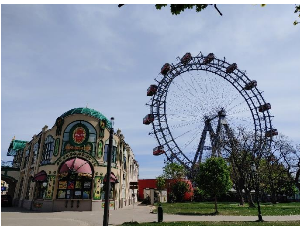
Blick auf das Wiener Riesenrad

HIGHLIGHTS: Wiener Riesenrad, Planetarium, „Wurstelprater“, Hauptallee, Pratercottage, Stadion, Trabrennbahn, Galopprennbahn, Lusthaus, Maria Grün, Heustadlwasser