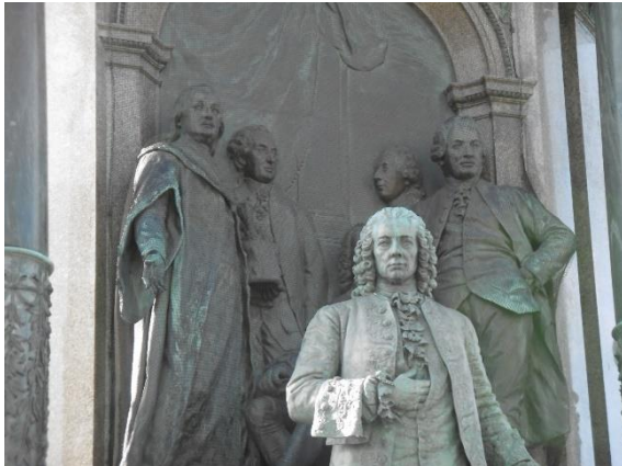
Anton Graf Grassalkovich I. (Maria-Theresien-Denkmal, ganz links)

HIGHLIGHTS: Kirche Am Hof, Palais Ferstel, Burgtheater, Kollonitsch-Denkmal, Maria-Theresien-Denkmal, Naturhistorisches Museum, Österreichische Nationalbibliothek, Augustinerkirche, Stephansdom, Pratercottage, Schwarzenbergplatz